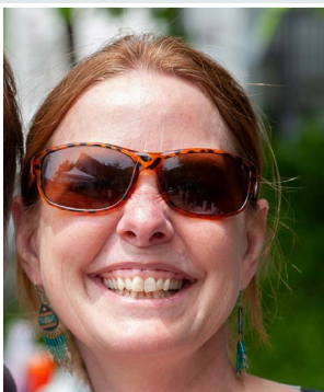
Ashland, Meredith y Wolfeboro

MShaddenCyr@LRcommunitydevelopers.org 603-524-0747, interno 105