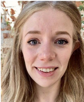
Laconia y Tilton

Los coordinadores de Servicios para Residentes (Resident Services Coordinators, RSC) de LRCD están aquí para conectarle con recursos que le ayuden a alcanzar sus metas.